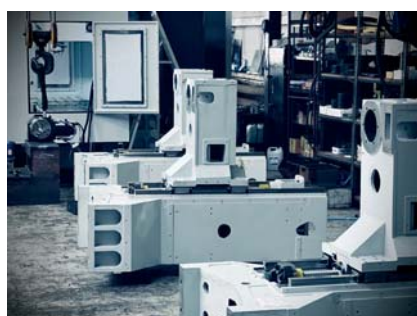
▲ ROBUSTE KOMponentEN