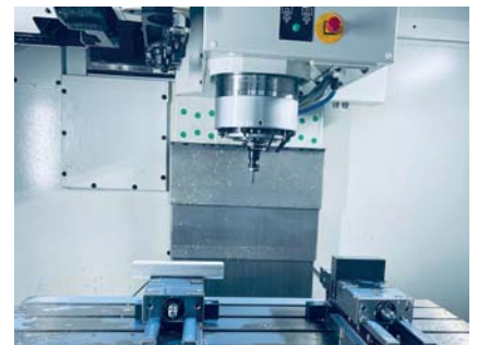
▲ VERGRÖSSERTER ARBEITSBEREICH