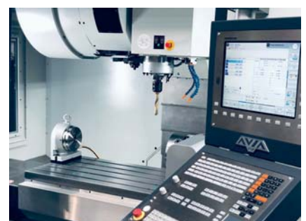
▲ HEIDENHAIN CNC SYSTEM