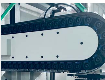
▲ 50 WERKZEUGWECHSLER