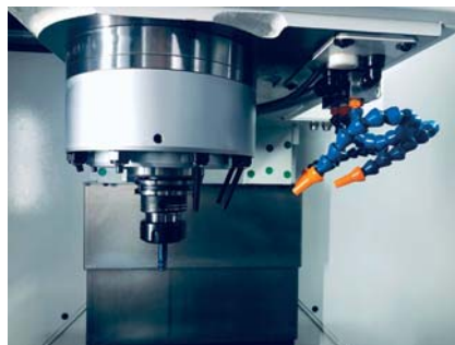
▲ DIREKTANTRIEB 15.000 U/min